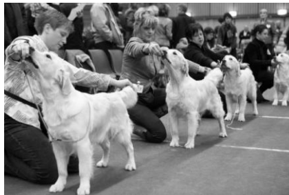
Derde prijs Martien Coppensprijz 2010: 'Schoonheidswedstrijden', gefotografeerd door Leo van Kuik en Leo Kwinten