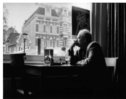
Eerste prijs Martien Coppensprijs 2010: 'Er was eens een leuk café in Utrecht',

De prijs is genoemd naar de inmiddels ook internationaal bekende Brabantse fotograaf Martien Coppens (1908 – 1986) . Een groot vakman en vooral bekend als documentaire fotograaf. Van zijn hand verschenen tientallen fotoboeken. Een groot deel zijn werk is ondergebracht in het Nederlands Fotomuseum en de Brabant-Collectie van de Universiteit van Tilburg .